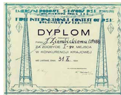
DYPLOM UZYSKANY PRZEZ SP1AR W PIERWSZYM SPDXCON-TESTIE