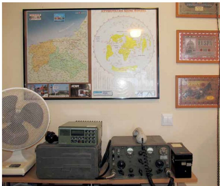
Stary sprzęt, mapy, dyplomy...