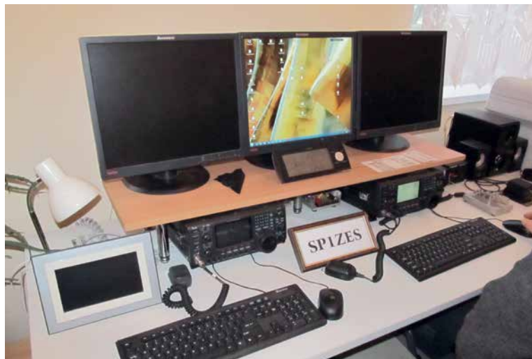
Dwa IC-746, dwa komputery, dwa klucze telegraficzne...

Znamy te sytuacje, gdy po latach istnienia cenionemu w mieście klubowi, mającemu